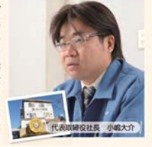
自己発信型企業への転換の機会に 株式会社 パール技研

新事業参入のトビテラを海洋に求めたその発想力とともに、業種の異なる中小企業が協力し、新たな産業技術の開発に取り組むというこのプロジェクトは、小さな会社同士でも、その結果のあり方次第で、社会が注目するものづくりができることを示していると思います。そして深海探査機に使用するガラスをぜひ国産で、当社にお声をかけていただいたことに、大きな栄誉と使命を感じています。海洋探査において高品質のガラス製品にニーズがあることを知るきっかけになりました。もともとガラスは生産加工時の異物混入やキズがなければ、例より強い素材ですから、江戸っ子1号の成功は国産ガラスの高い性能を世に示す絶好の機会にもなるかと期待しています。