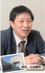
中小企業のメリットをより生かして 芝浦工業大学