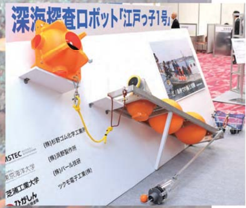
深海探査ロボット「江戸っ子1号」 ASTEC (株)杉野ゴム化学工業所 (株)海洋製作所 (株)パール技研 ツクモ電子工業(株) 江戸っ子1号 8,000mの深海を海底まで潜水し、海底の試料採取と画像撮影をして水上に帰還するフリーフォーム型の深海水下ロボット。球形の樹脂カバの下は耐圧ガラスで、その中に画像撮影機器、照明装置、バッテリー、GPS装置などをそれぞれ独立して設置。ガラス球向上の間を「電気を逃すゴム」が連結し、海中では不可能といわれた無線通信機を実現した。