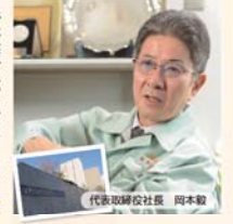
新たなニーズを知る良いきっかけに 岡本硝子 株式会社

新事業参入のトビテラを海洋に求めたその発想力とともに、業種の異なる中小企業が協力し、新たな産業技術の開発に取り組むというこのプロジェクトは、小さな会社同士でも、その結果のあり方次第で、社会が注目するものづくりができることを示していると思います。そして深海探査機に使用するガラスをぜひ国産で、当社にお声をかけていただいたことに、大きな栄誉と使命を感じています。海洋探査において高品質のガラス製品にニーズがあることを知るきっかけになりました。もともとガラスは生産加工時の異物混入やキズがなければ、例より強い素材ですから、江戸っ子1号の成功は国産ガラスの高い性能を世に示す絶好の機会にもなるかと期待しています。