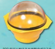
800気圧に耐える半球型のガラスを2つ貼り合わせて球状に、その外を樹脂でカバーする。樹脂製作が道のガラス球は直径が33cmに66。

は相互に付加価値をもたらす文字通りの成果を感じています。機構が東京下町の企業と接点を果たしたのは自分たちが初めてです。それだけに江戸っ子1号にかかる期待は大きいです。