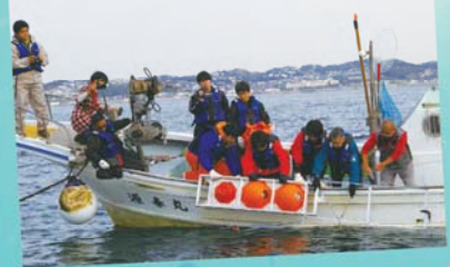
平成24年11月に江戸湾にて、水深57mの海中での2度目の試験潜水に成功しました。

江戸っ子1号の技術開発では、海底での画像撮影機器と照明装置の制御、バッテリー機能の制御の2つをコアに、プロジェクトに携わっています。現時点では撮影機は3Dを基本に装置の開発を進めていますが、探査対象のニーズによっては2Dを選択してより鮮明な画像を確保する選択も検討中です。また試験探査の海深深度が増すにつれて、探査機の着底を検知する機器の制御も欠かせないでしょう。江戸っ子1号の一日も早い商品化を、小回りの利く中小企業ならではのスケールメリットを生かしてまいります。プロジェクトには研究室が必ずしも参加していませんが、彼らについても企業もものづくりの現場を体験する絶好の機会になっています。