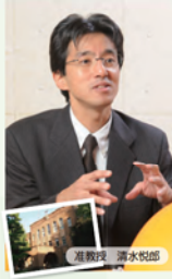
町工場の技術と仕事の速さに瞠目 東京海洋大学

江戸っ子1号の技術開発では、海底での画像撮影機器と照明装置の制御、バッテリー機能の制御の2つをコアに、プロジェクトに携わっています。現時点では撮影機は3Dを基本に装置の開発を進めていますが、探査対象のニーズによっては2Dを選択してより鮮明な画像を確保する選択も検討中です。また試験探査の海深深度が増すにつれて、探査機の着底を検知する機器の制御も欠かせないでしょう。江戸っ子1号の一日も早い商品化を、小回りの利く中小企業ならではのスケールメリットを生かしてまいります。プロジェクトには研究室が必ずしも参加していませんが、彼らについても企業もものづくりの現場を体験する絶好の機会になっています。