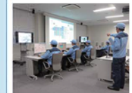
運転シュミレーション