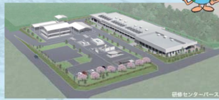
研修センターパース

東京都下水道局総務部財課が平成25年2月に編集・発行した「経営計画2013」という資料には、発足以来50年を過ぎ、新たな半世紀に入った下水道局の今後の画が示されている。その第三部「サード」の向上と経営基盤の強化に、未見聞文化体制づくりと躍された項目があり、課題に「最少の経費で最高のサービスを提供するために」とある。そのために必要な要素として挙げられているのが、 ●東京都の下水道事業は、事業実施に責任を持つ下水道局を中心として、下水道局、監理団体1（東京都下水道サービス株式会社）及び民間事業者がそれぞれの特性を活かした役割分担のもと、一層連携を強化して運営する。 ●将来にわたって下水道サービスを安定的に提供していくため、下水道事業を支える人材の育成と技術の継承に取り組む。 ●基本的には、将来に向けた体制づくりのために「監理団体（TGS）」を活用した効率的な事業運営、「民間事業者との連携強化」を