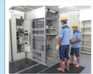
電気保安点検用配電設備

しかし単にベテラン職員が培ってきた技術やノウハウを映像化したり、データベース化したりしても、現場で培われた経験と対応力は完全には継承できない。若い職員とベテラン職員が実際に同じ場所に同じ時間において、そこで起こることを共有してこそ、ノウハウが継承されていくものなのだ。 そこで東京都下水道局がおよそ18億円を投じて江東区新砂にある砂町水再生センター内に完成させたのが「下水道技術実習センター」である。 ここでは、さまざまな分野の実習や疑似体験など自ら体感するプロセスを通じて、実際に現場で体感することで技術や業務ノウハウの継承を効果的かつ効果的な知識・技術の早期習得と技術・業務ノウハウの継承を推進するという。 敷地面積1万3800平方メートルというから東京ドーム3分の1ほどの広さの敷地内には32種類におよぶ内外実習施設を配置されていて、下水道事業の技術を学ぶことが