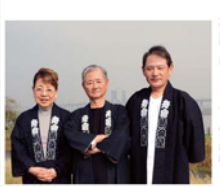
〒136-0074 東京都江東区東船場 4-17-12 TEL:03-3644-1344 FAX:03-3644-5445 E-mail:info@haramachi.co.jp

レインボータウンFM: FAX:03-5634-0792 大浜アワイド Super Saturday 14: RUSTREAM: 19:ヒアザルシヤカ: のインターネット放送でもお楽しみいただけます。 ※番組は予告なく変更する場合があります。予めご了承ください。